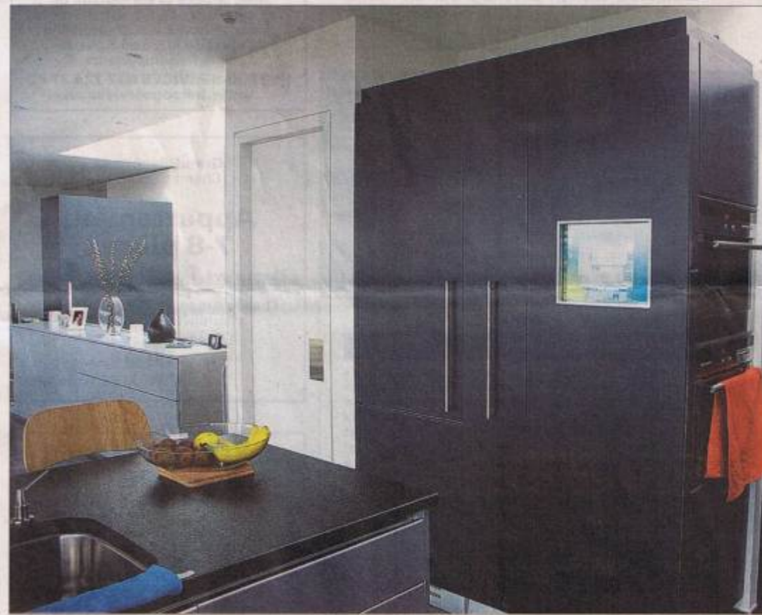
La maison domotique permet de gérer à distance énergie, sécurité et communication. PAUDEX, 6 MARS 2008

central de l'Union suisse des installateurs-électriciens (USIE). Les électriciens se trouvaient face à plusieurs systèmes complexes qu'ils devaient demander des formations différentes à chaque fois.» Cependant, depuis l'introduction, en 2006 au niveau mondial, d'une norme baptisée KNX la domotique est devenue beaucoup plus accessible et, par conséquent beaucoup plus abordable. Un autre phénomène a freiné sa propagation. Les électriciens, réticents face à une technologie qu'ils maîtrisent mal, ont tendance à renchérir artificiellement leurs devis, décourageant de ce fait les propriétaires intéressés.